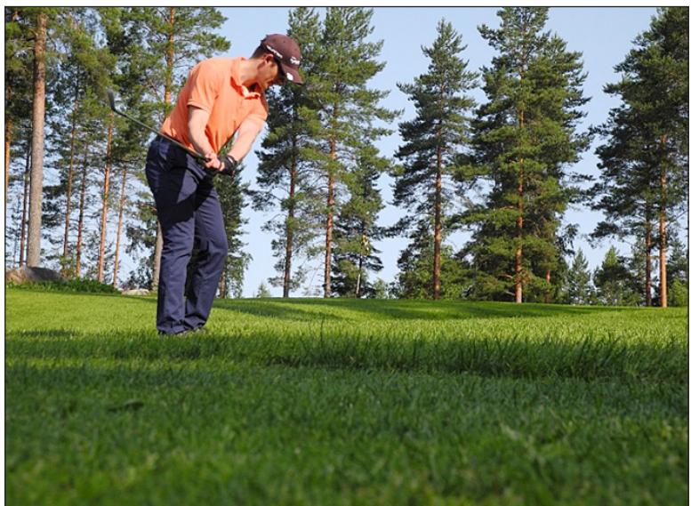
Viheriöiden lähialue vaikuttaa usein merkittävästi tuloksetekoon. Siksi sitä on syytä varjella liialliselta kulutukselta.

Kuluneella kaudella kentänhoitoon oli käytettävissä suunnitellusti hieman enemmän henkilöresurssia, kuin edellisenä vuonna. Silti moneen muuhun kenttään verrattuna men-