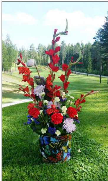
Avauspaikan kukka-asetelma, Aida Avec Open.