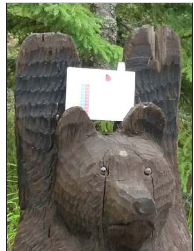
Karhu ja Kerigolfin Kerttu tuloskortti.

olla yhtä sointuva nimi eli Kerigolfin Kerttu.